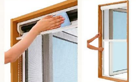
上げ下げロール網戸XMW