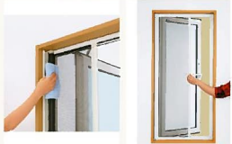
横引きロール網戸XMY